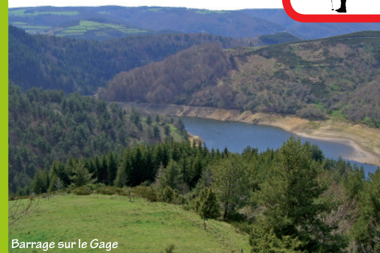
Barrage sur le Gage